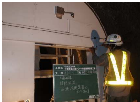
扉の周囲に仕上げの