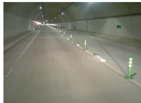
トンネル内で中央分離ブロックを設置