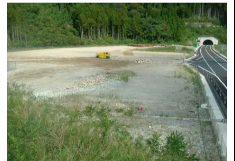
大島地区の管理施設ヤードの整地

三遠南信自動車道の開通に向けて、法面の保護や排水路等の整備をする工事です。安全第一で施工しますので、宜しくお願い致します。