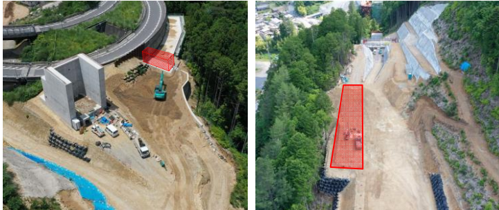
地盤改良工事 完了