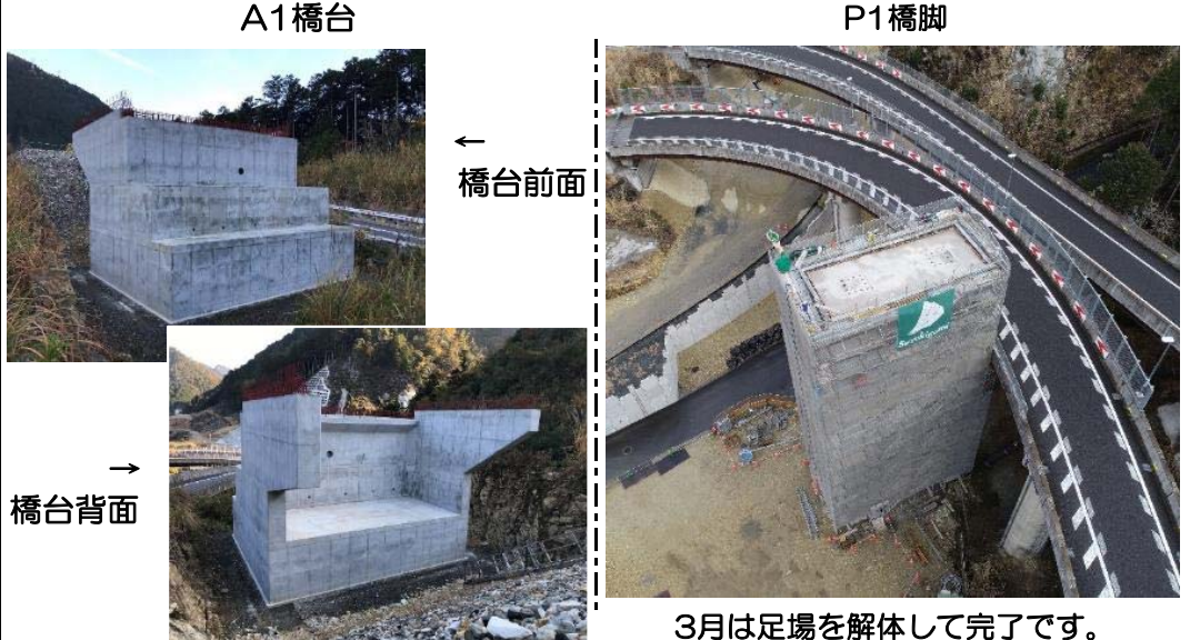
3月は足場を解体して完了です。