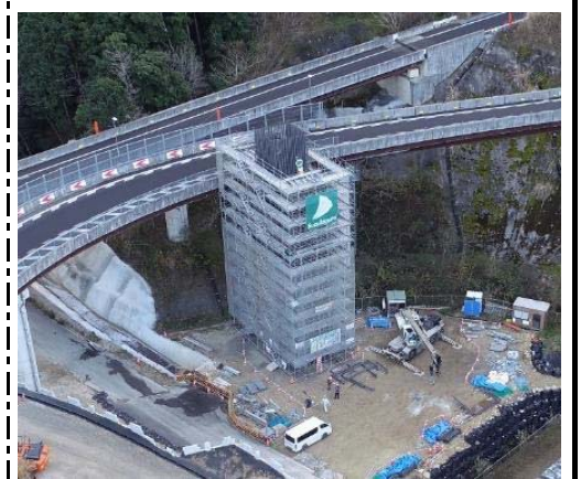
残り2ロット(柱と梁)を打設します。