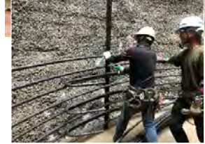
深礎鉄筋 組立状況