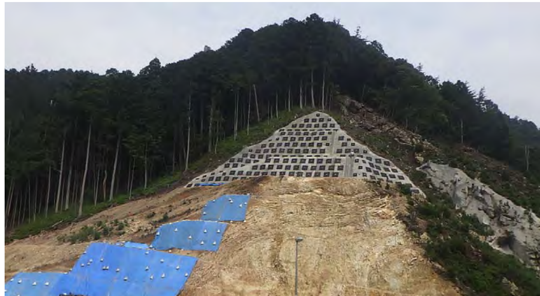
山側機能補償道路の法面工事

7月末をもちまして全ての工事が無事完了しました。地元住民の皆様方におかれましては、ほんとうに長い間ご協力ありがとうございました。