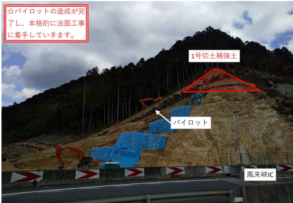
山側機能補償道路の法面工事

山側機能補償道路の工事用パイロットの造成が完了し、4月から本格的に法面工事(土工事、切土補強土工事)に着手する予定です。また、9号橋P1橋脚の仮設ヤード造成工事も引き続き進めてまいります。