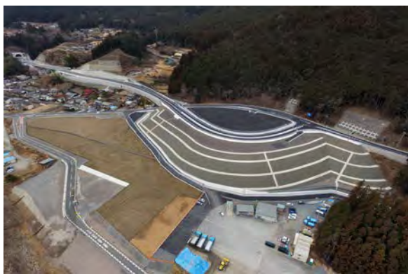
川合工区施工完了

進捗状況 皆様のご協力のおかげで工事を完了させることができました。ありがとうございました。