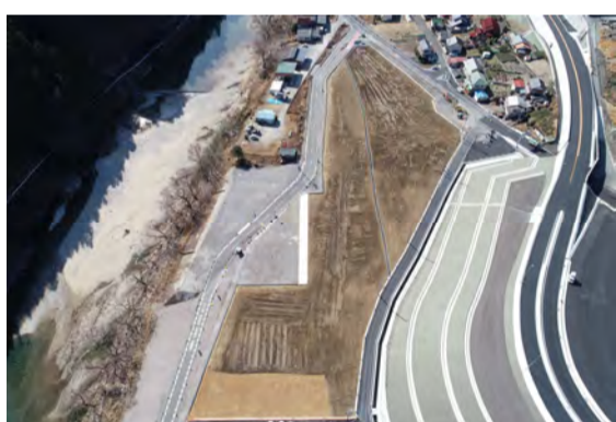
造成地耕作土盛土完了

進捗状況 造成地の耕作土盛土は完了しました。現在は佐久間川合IC、ランプ周りに立入防止柵と境界杭を設置しています。