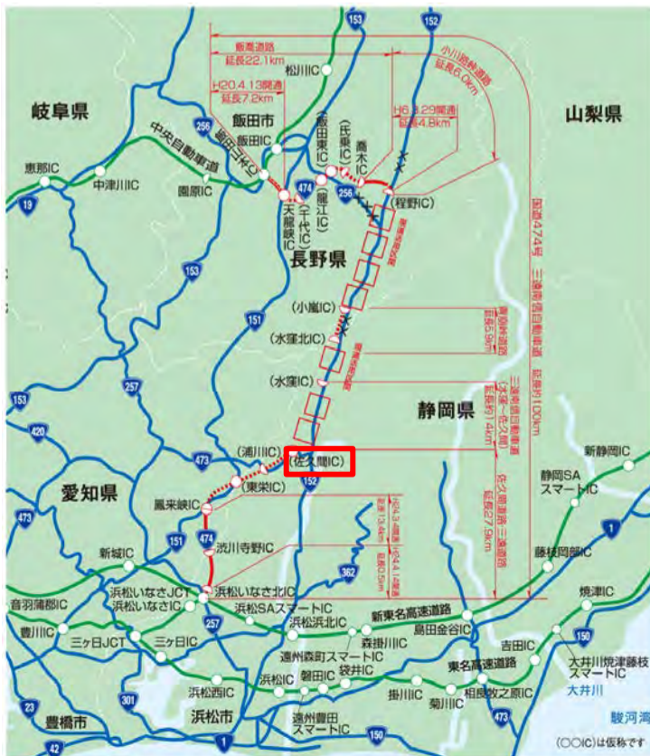
三遠南信自動車道位置図

・工事の状況は、浜松河川国道事務所ホームページで紹介されています。 ↓ ↓ ↓ ↓ ↓