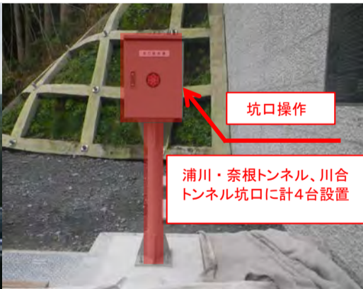
坑口操作器設置状況