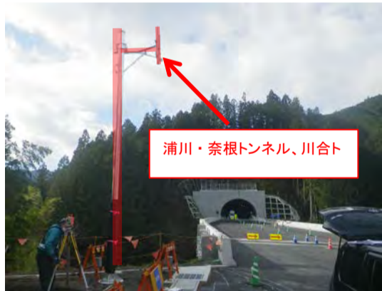
空中線柱、空中線設置状況

進捗状況 12月は、浦川・奈根トンネルと川合トンネルの機器設置及びケーブルのつなぎ込みを行っています。1月から単体試験と総合試験に向け、丁寧に作業を進めています。