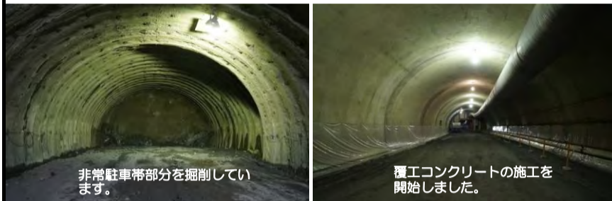
トンネル掘削 非常駐車帯部分を掘削しています。

進捗状況 トンネル坑口部の掘削と、トンネルずりの判定、運搬を行っています。 3/28時点進捗: 628.7m(上半)/ 2.408m