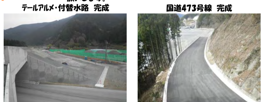
テールアルメ・付替水路 完成

進捗状況 3月末で本工事が完了しました。施工におきましては、ご理解とご協力の程ありがとうございました。今後ともよろしくお願いたします。