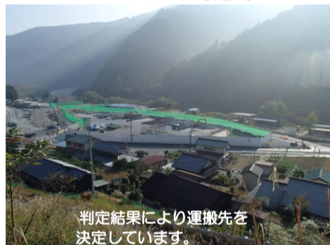
トンネルずり判定場