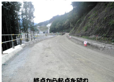
終点から起点を望む

進捗状況 BOX周辺にて排水工事等を引き続き行います。11月中旬に規制切り換えを予定しています。 11月初旬より佐久間川合24号線の規制工事を行います。 国道473号線 切土・盛土完了 佐久間川合24号線 規制工事