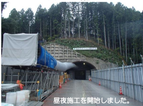
昼夜施工を開始しました。