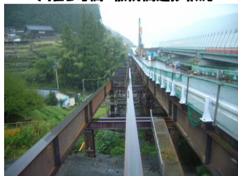
川合2号橋 仮橋進捗状況