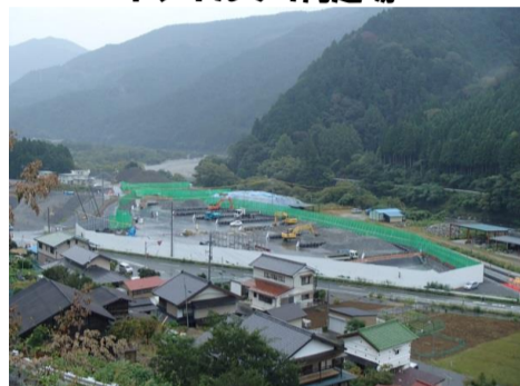
トンネルずり判定場