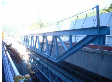
川合2号橋 仮橋移設予定