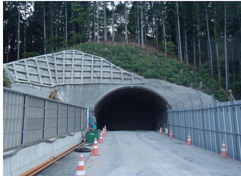
トンネルずり判定場