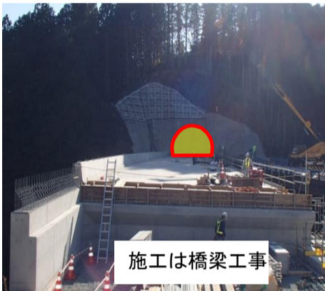
トンネル坑口位置