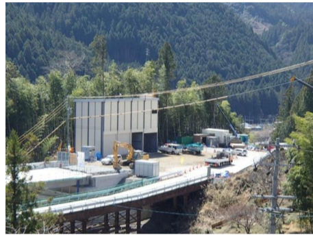
仮設備ヤード全景