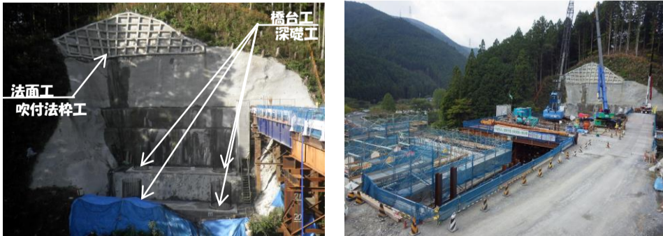
佐久間IC(仮称)側から撮影

深礎工事、橋台1基のコンクリート打設が完了しました。引き続き橋台躯体工事、橋脚工事を施工していきます。