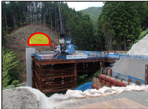
トンネル坑口位置