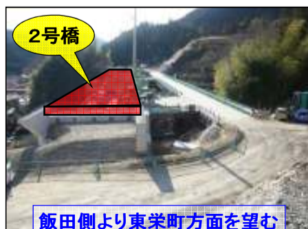
飯田側より東栄町方面を望む