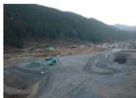
施工箇所 佐久間IC南側(追加ヤード)