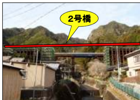
飯田側より東栄町方面を望む