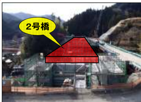
飯田側より東栄町方面を望む