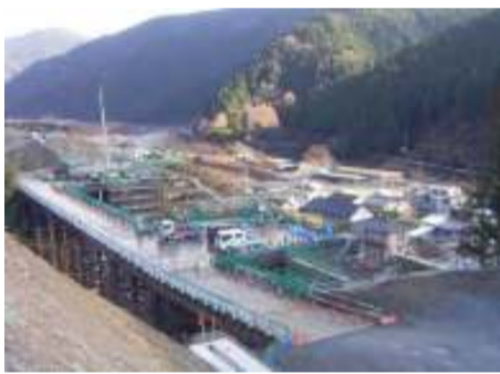
施工箇所写真(東から撮影)