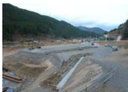
施工箇所 佐久間IC南側(追加ヤード)