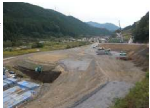
撮影箇所 国道473号線東側から撮影