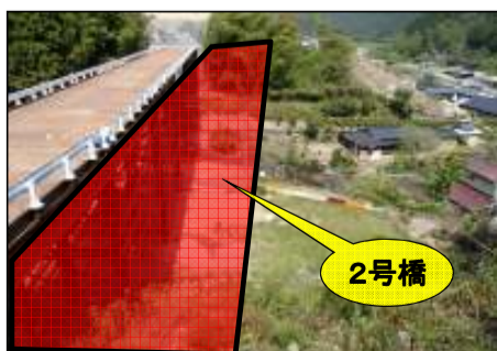
東栄町側より飯田方面を望む