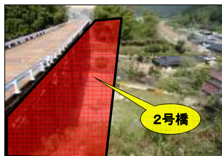
東栄町側より飯田方面を望む