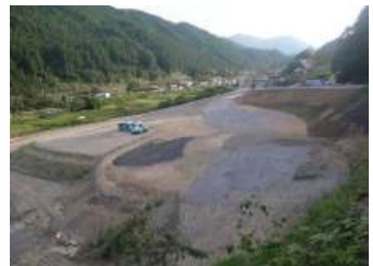
撮影箇所 国道473号線東側から撮影