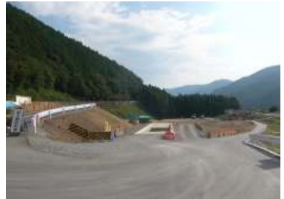
撮影箇所 国道473号線西側から撮影