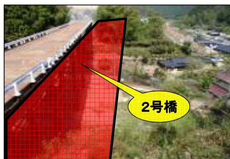
東栄町側より飯田方面を望む