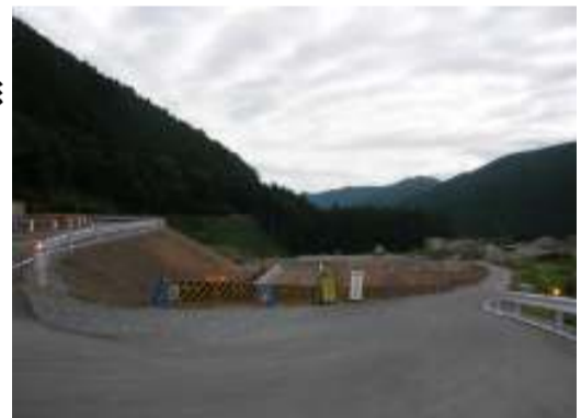
撮影箇所 国道473号線西側から撮影