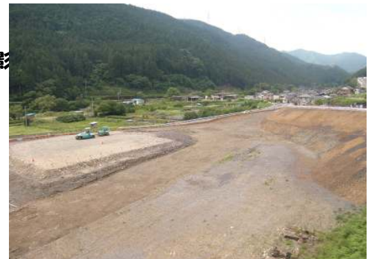
撮影箇所 国道473号線東側から撮影