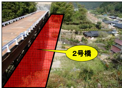
東栄町側より飯田方面を望む