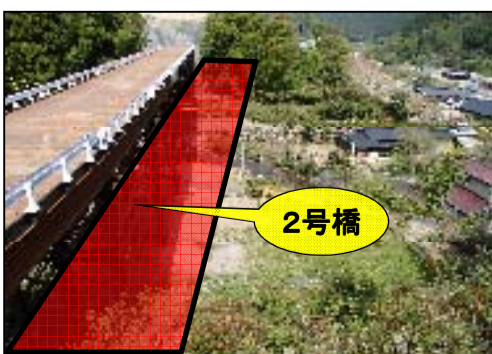
東栄町側より飯田方面を望む