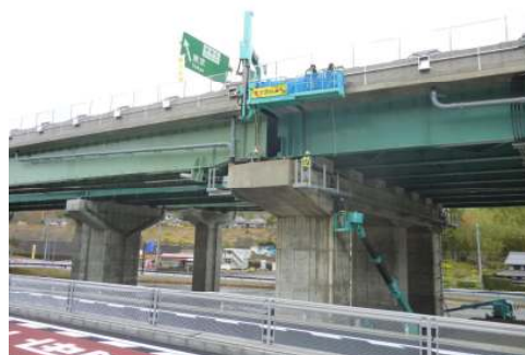
東黒田高架橋にてケーブル通線施工状況