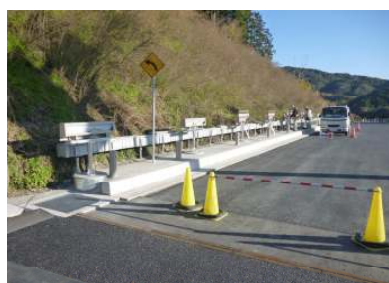
Gランプにて低位置照明(自立用)設置