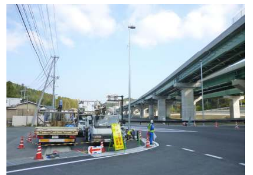
引佐北IC交差点にて道路照明灯の設置状況