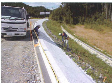
Gランプにて軽量ダクト支持杭の設置