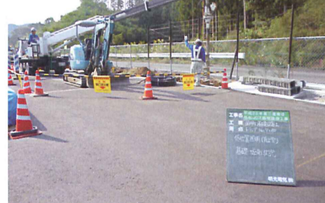
Fランプ合流部にて低位置照明の基礎工事