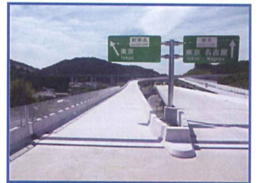
[工事終点側から望む]