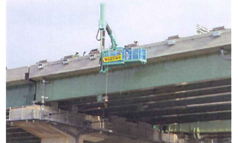
Gランプ橋にて低位置照明の設置