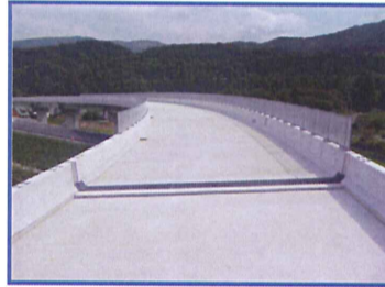
[工事起点側から望む]