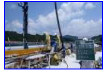
ポンプ車にて コンクリート打設