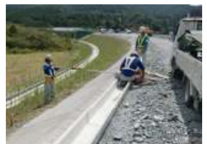
Fランプ法面に軽量ダクト位置出し作業