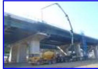
壁高欄工施工状況