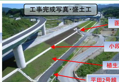
工事完成写真・盛土工