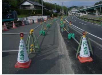
引六線施工は歩行者通路を設けておりますので御通行の際はこちらをお通り下さい。

7月末現在、本線部・ランプ部のアスファルト安定処理が終了しました。8月より基層工の施工に入ります。先月同様、材料運搬時には多くの大型ダンプの通行が予想されます。また、引六線では歩道整備のため排水構造物の施工を行っています。今後も安全第一で工事を進めてまいります。近隣の皆様、御通行中の皆様にはご理解とご協力をお願いします。