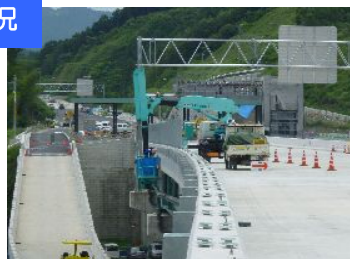
橋梁点検車にて作業中