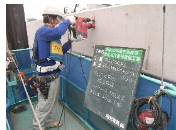
アンカー打設状況