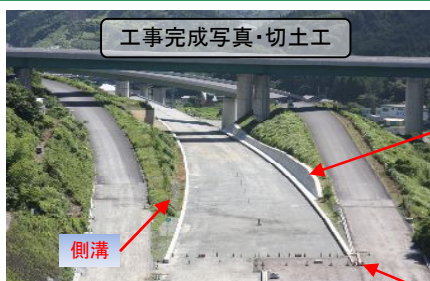
工事完成写真・切土工