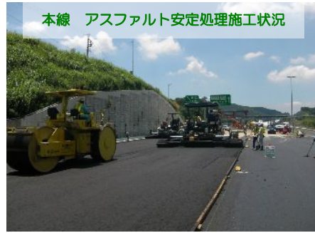
本線 アスファルト安定処理施工状況