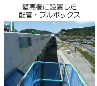
壁高欄に設置した配管・プルボックス

三遠南信自動車道「引佐ジャンクション」の 工事完了 をお知らせします。 ご協力ありがとうございました。