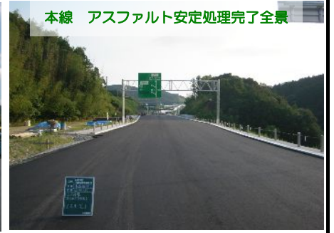
本線 アスファルト安定処理完了全景