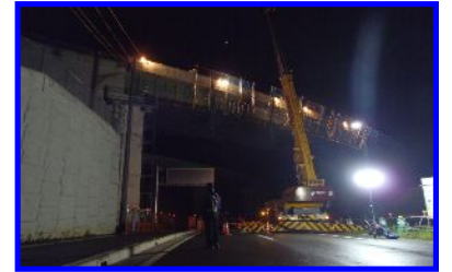
【夜間での足場解体作業状況】

当工事の進捗率は約80%です。現在、壁高欄及び橋梁付属物の施工を行なっています。又、7月中旬から夜間施工にて橋梁足場の解体を行ない、交通規制の実施に伴う作業は完了しました。ご不便を掛けましたが、ご協力ありがとうございました。今後も何かとご迷惑をお掛けすることもあると思いますが、ご理解とご協力をお願いします。