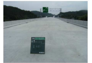
照明を設置する東黒田高架橋

地元の皆様へご迷惑をおかけしない様作業をさせていただきます。一般車両の方・歩行者の方の通行を妨げない様万全を期します。