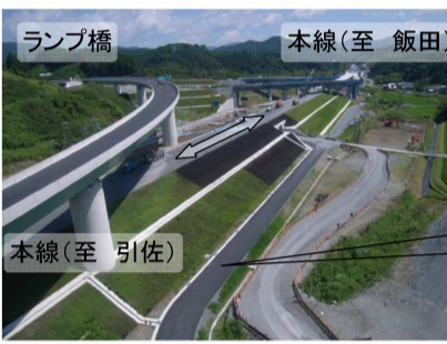
ランプ橋 本線(至 飯田) 本線(至 引佐)