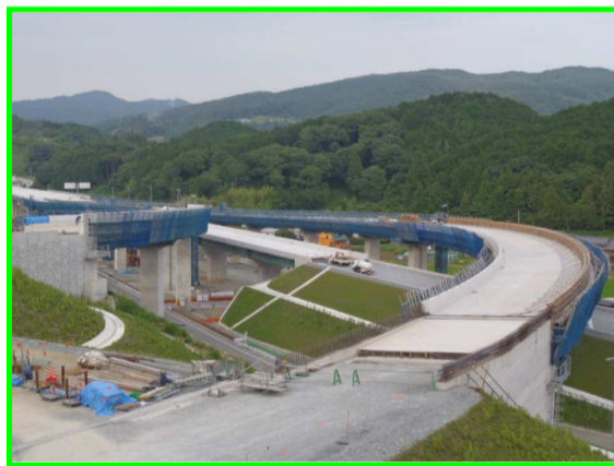
[床版工事 施工全景]

当社は、引佐JCTのGランプ、Fランプの床版橋工事を担当しています。 ※RC床版橋とは・・・鋼板にて構成された鋼鈑桁・鋼箱桁等の上部に鉄筋とコンクリートを組合せ構築した床版で一般的な在来工法の橋梁です。