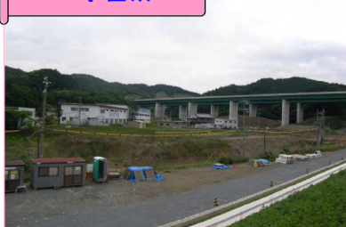
土砂積込場所全景