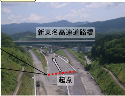
新東名連絡路(引佐⇄三ヶ日)