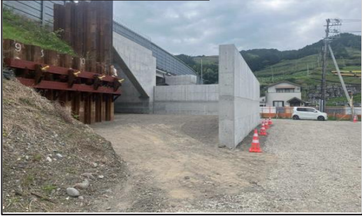
①大代IC番生寺跨道橋