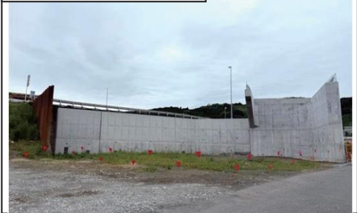
⑤大代IC Bランプ橋背面