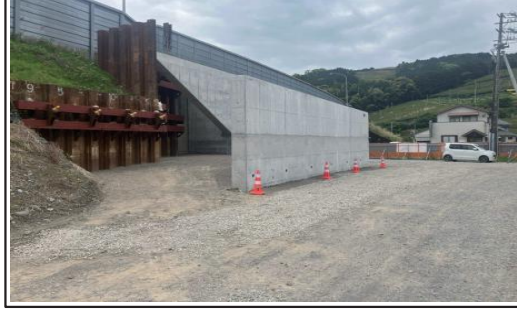
②大代IC番生寺跨道橋