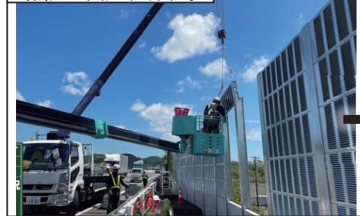
⑦大井川右岸(遮音板設置)