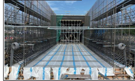
④大代ICランプBOXカルバート(鉄筋)