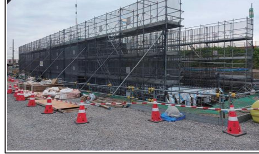
③大代ICランプBOXカルバート(鉄筋)