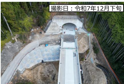
⑤ 三遠川合トンネル (仮称：1号トンネル)