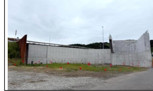
④大代IC Bランプ橋背面