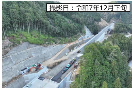
① 鳳来峡IC (本線部)