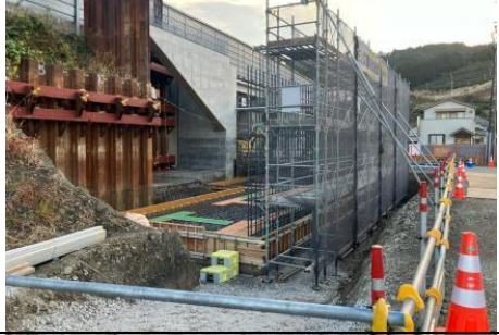
①大代IC 番生寺跨道橋(擁壁工)