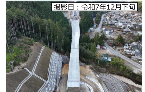
④ 三遠8号高架橋 (仮称：8号橋)