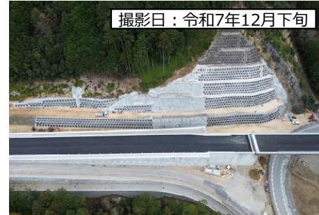
③ 鳳来峡IC (Cランプ)