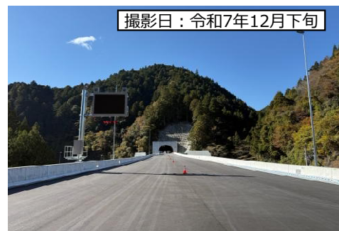
⑦ 三遠1号高架橋 (仮称：1号橋)