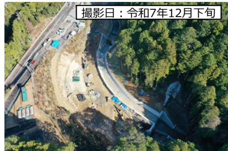
② 鳳来峡IC (六所川付替)