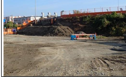
③大代IC ランプBOXカルバート(仮設工)