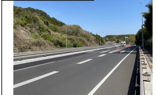
⑦旗指IC(東京方面を望む)