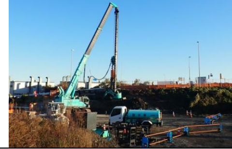
②大代IC ランプBOXカルバート(仮設工)