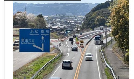
⑧旗指IC(名古屋方面を望む)