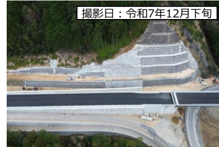
③ 鳳来峡IC (Cランプ)