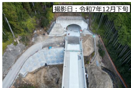
⑤ 1号トンネル (仮称)