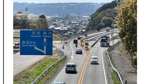
⑧旗指IC(名古屋方面を望む)