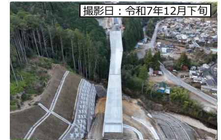
④ 8号橋 (仮称)