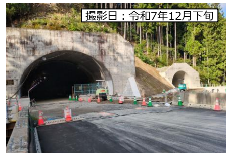
⑥ 3号トンネル (仮称)