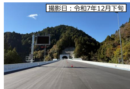
⑦ 1号橋 (仮称)