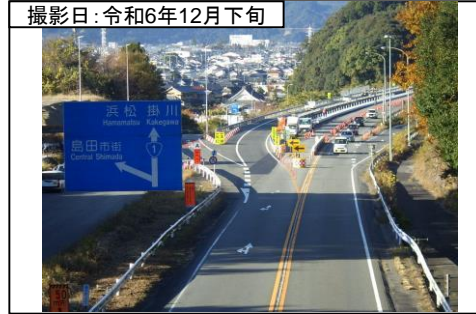
⑦旗指IC(名古屋方面を望む)