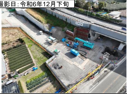
①大代IC 番生寺跨道橋