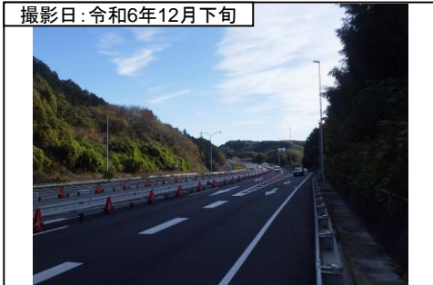
⑥旗指IC(東京方面を望む)