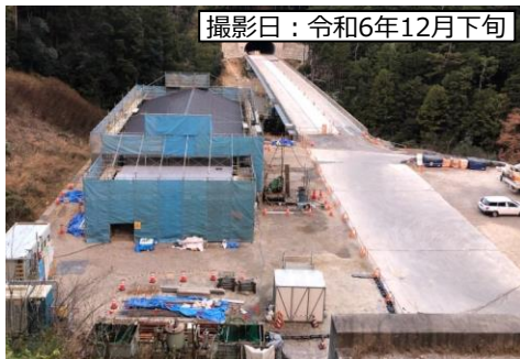
⑤トンネル副電気室