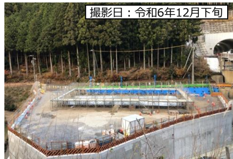
⑥トンネル主電気室