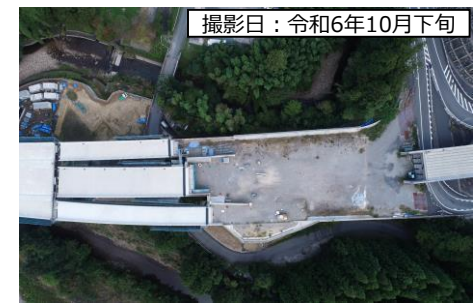
⑦ 4号トンネル (仮称)