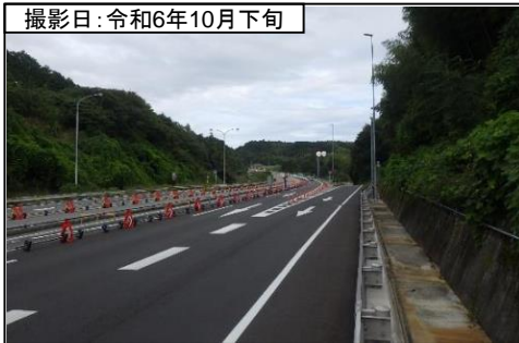
⑥旗指IC(東京方面を望む)