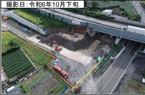
①大代IC 番生寺跨道橋