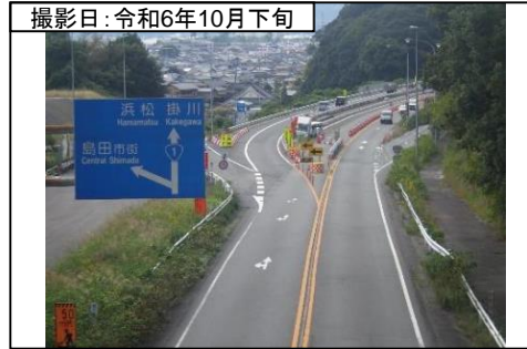
⑦旗指IC(名古屋方面を望む)