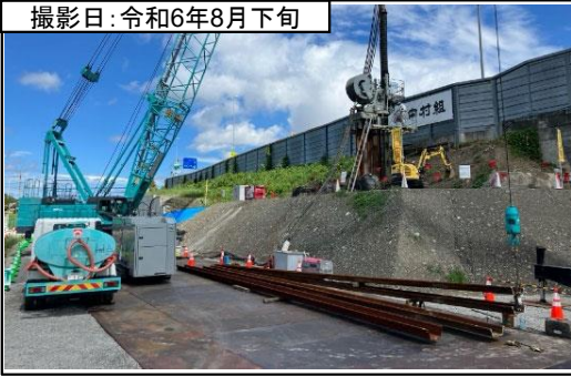
①大代IC 番生寺跨道橋