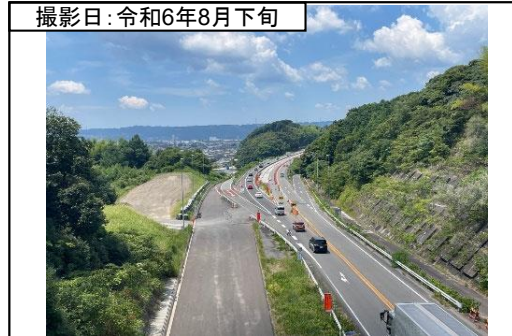
⑦旗指IC(名古屋方面を望む)