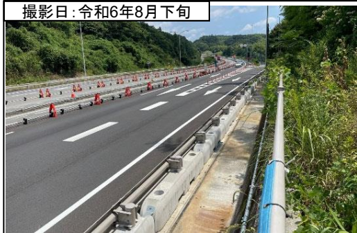
⑥旗指IC(東京方面を望む)