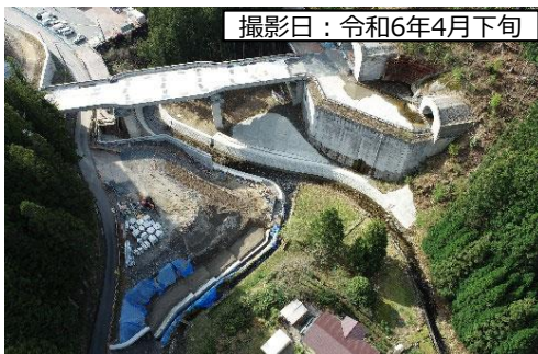
撮影日：令和6年4月下旬