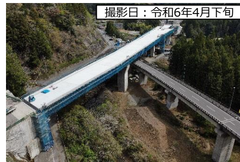
撮影日：令和6年4月下旬