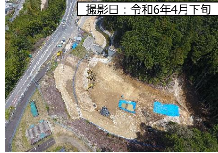
撮影日：令和6年4月下旬