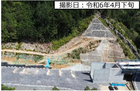
撮影日：令和6年4月下旬