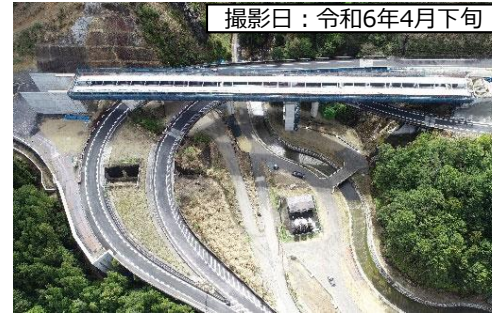
撮影日：令和6年4月下旬