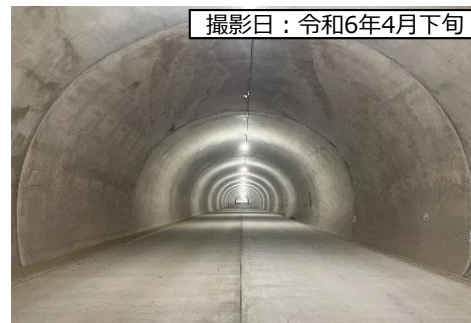
撮影日：令和6年4月下旬