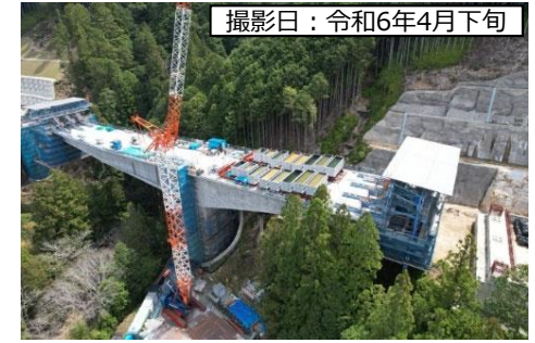
撮影日：令和6年4月下旬