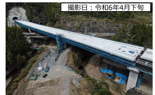
撮影日：令和6年4月下旬