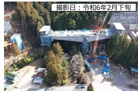
撮影日：令和6年2月下旬