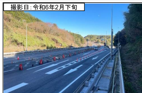
⑥旗指IC(東京方面を望む)