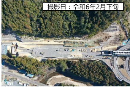
撮影日：令和6年2月下旬