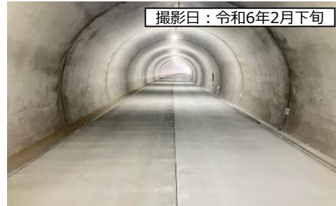
撮影日：令和6年2月下旬