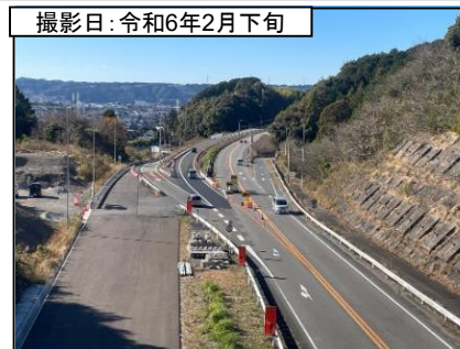
⑦旗指IC(名古屋方面を望む)