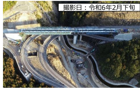
撮影日：令和6年2月下旬