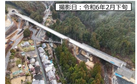
撮影日：令和6年2月下旬