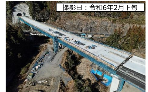
撮影日：令和6年2月下旬