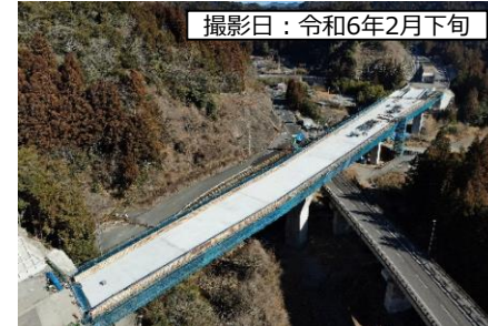
撮影日：令和6年2月下旬