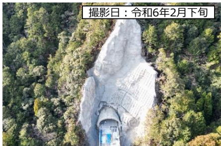
撮影日：令和6年2月下旬