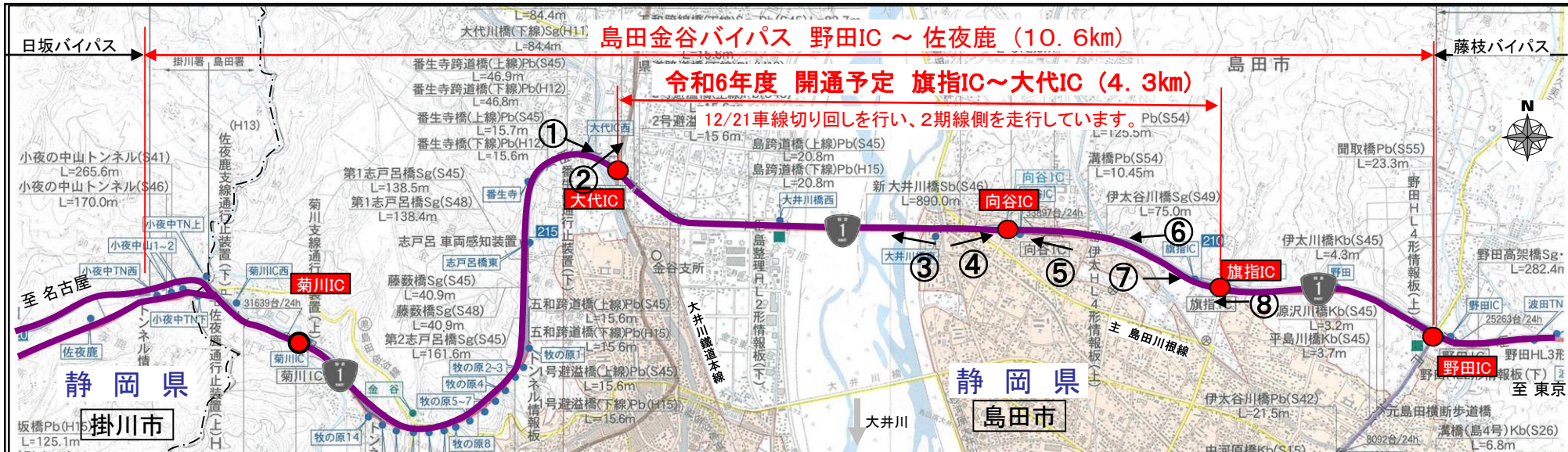
④向谷IC(東京方面を望む)