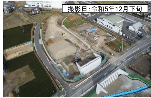
撮影日: 令和5年12月下旬