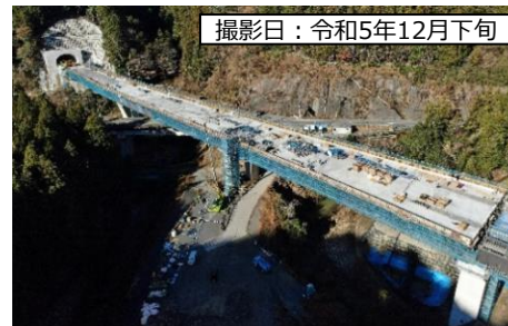
撮影日：令和5年12月下旬