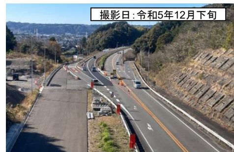
撮影日: 令和5年12月下旬