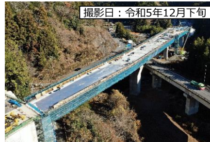
撮影日：令和5年12月下旬