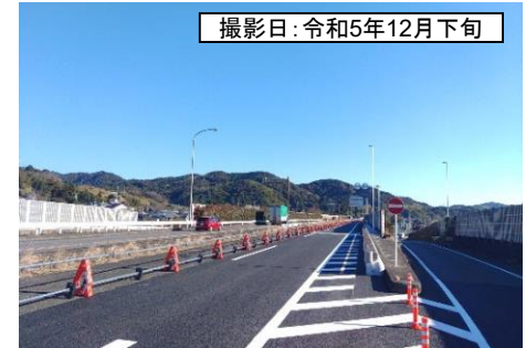
撮影日: 令和5年12月下旬