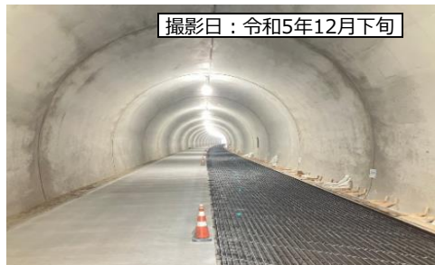
撮影日：令和5年12月下旬