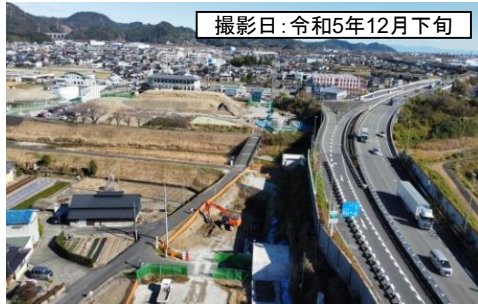
撮影日: 令和5年12月下旬