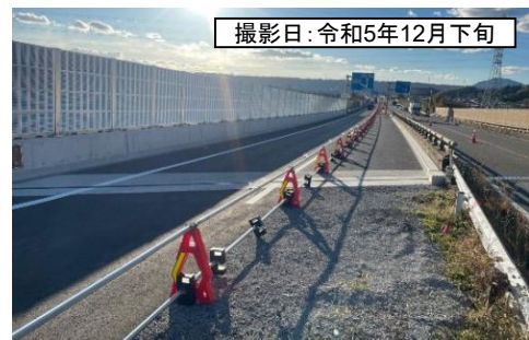
撮影日: 令和5年12月下旬