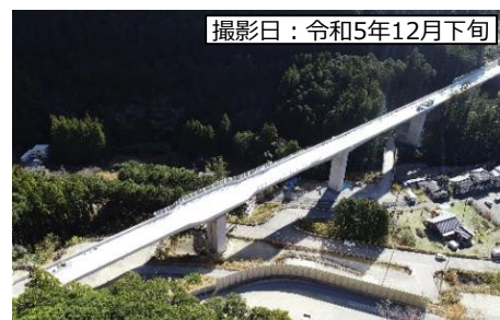
撮影日：令和5年12月下旬