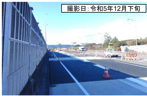
撮影日: 令和5年12月下旬