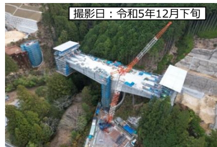
撮影日：令和5年12月下旬