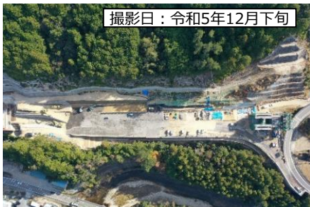
撮影日：令和5年12月下旬