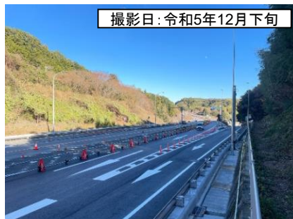
撮影日: 令和5年12月下旬