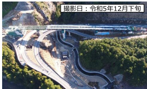
撮影日：令和5年12月下旬