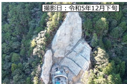
撮影日：令和5年12月下旬