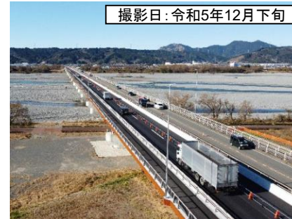
撮影日: 令和5年12月下旬