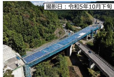
⑦ 1号橋 (仮称) 北向き