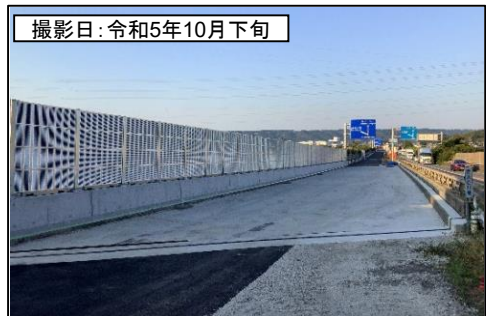
⑥伊太谷川橋(名古屋方面を望む)