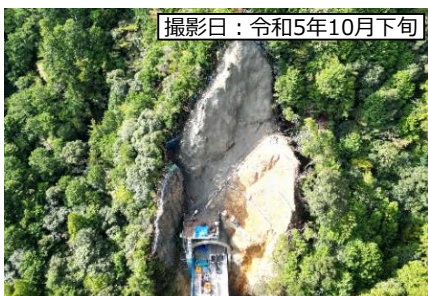
⑤ 1号トンネル (仮称) 北向き