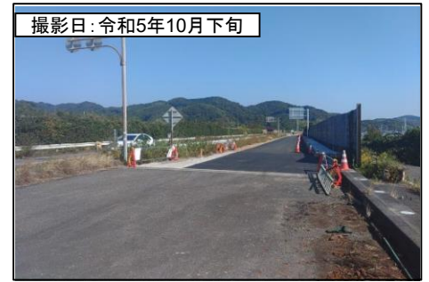
④向谷IC(東京方面を望む)