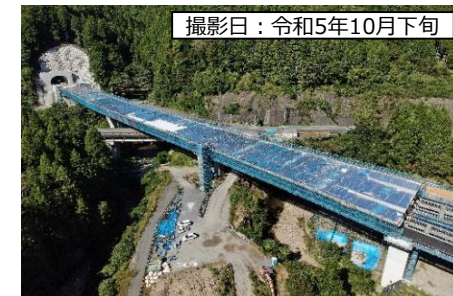
⑧ 1号橋 (仮称) 南向き