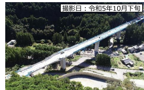
④ 7号橋 (仮称)