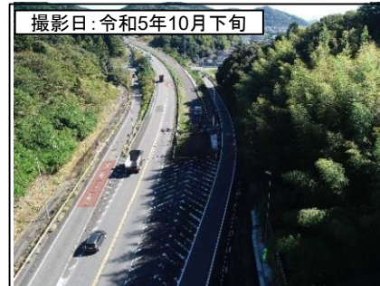
⑦旗指IC(東京方面を望む)