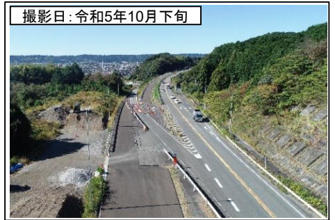
⑦旗指IC(名古屋方面を望む)