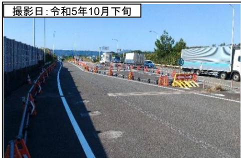
⑤向谷IC(名古屋方面を望む)