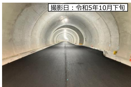
⑥ 4号トンネル (仮称)