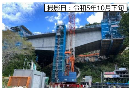
③ 8号橋 (仮称)