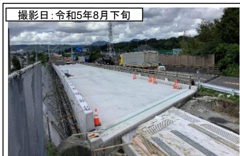
⑥伊太谷川橋(名古屋方面を望む)