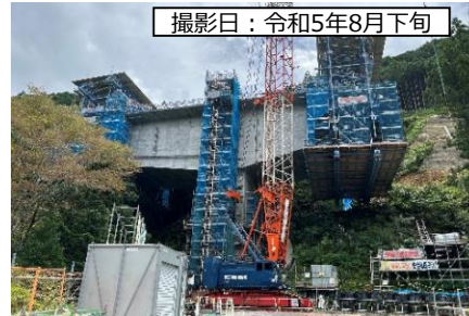
③ 8号橋 (仮称)