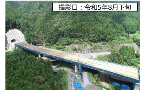
⑧ 1号橋 (仮称) 終点側