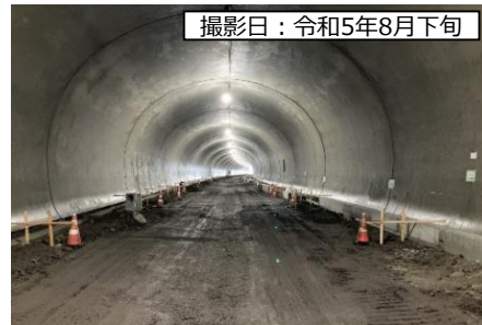
⑥ 4号トンネル (仮称)