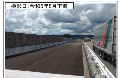
④島田第1高架橋(名古屋方面を望む)