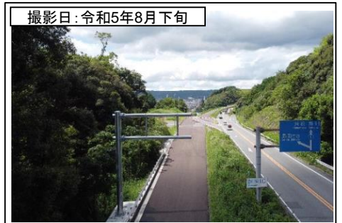
⑧旗指IC(名古屋方面を望む)