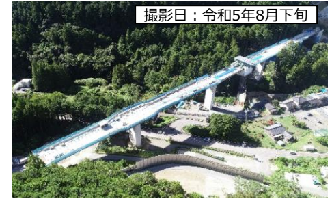
④ 7号橋 (仮称)