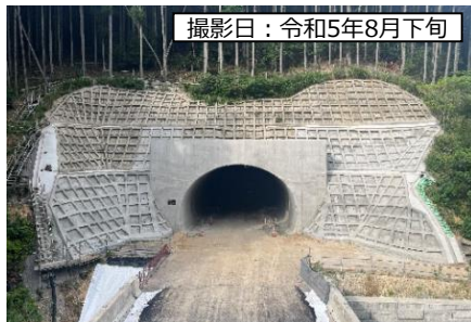
⑤ 4号トンネル (仮称)