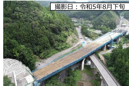
⑦ 1号橋 (仮称) 起点側