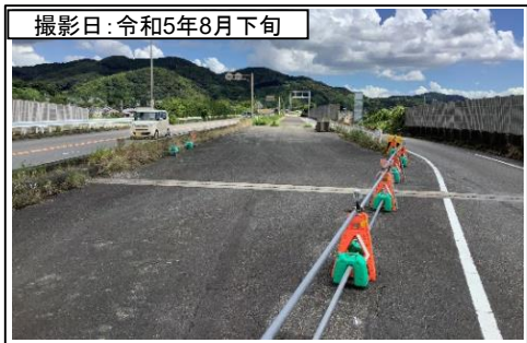
⑤向谷IC(東京方面を望む)