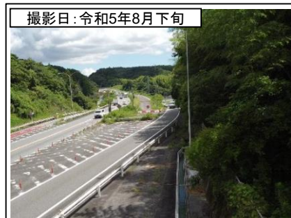
⑦旗指IC(東京方面を望む)