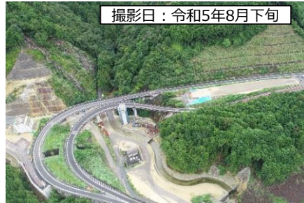
② 9号橋 (仮称)