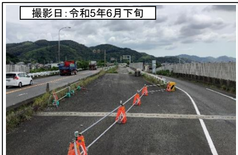
⑤向谷IC(東京方面を望む)