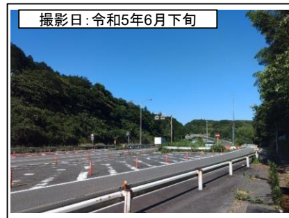
⑦旗指IC(東京方面を望む)