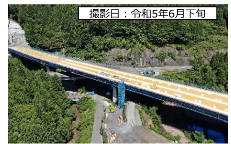
撮影日：令和5年6月下旬