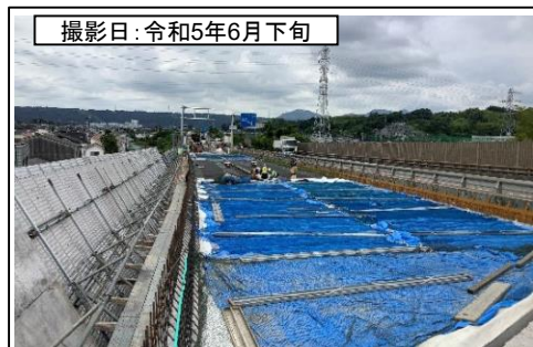
⑥伊太谷川橋(名古屋方面を望む)