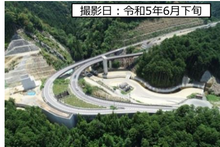
撮影日：令和5年6月下旬