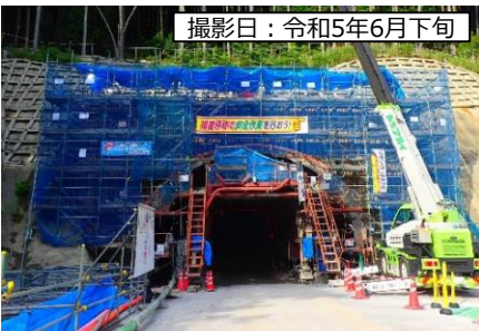
撮影日：令和5年6月下旬