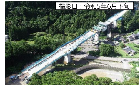
撮影日：令和5年6月下旬