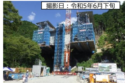
撮影日：令和5年6月下旬