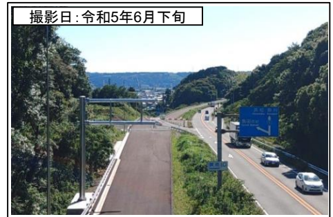
⑧旗指IC(名古屋方面を望む)