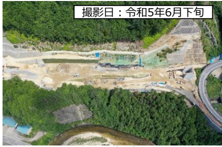
撮影日：令和5年6月下旬