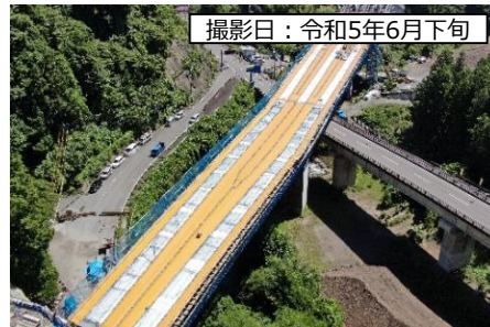
撮影日：令和5年6月下旬