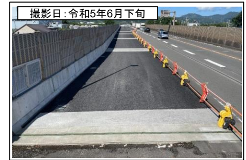
④島田第1高架橋(名古屋方面を望む)