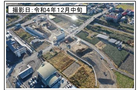
撮影日: 令和4年12月中旬