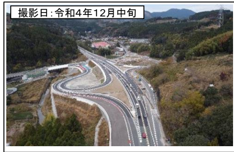
撮影日: 令和4年12月中旬