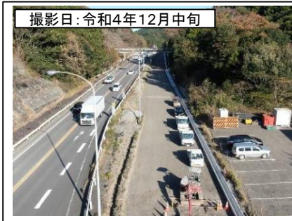
撮影日: 令和4年12月中旬