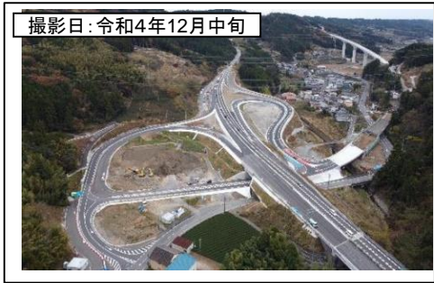
撮影日: 令和4年12月中旬