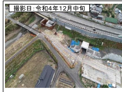
撮影日: 令和4年12月中旬