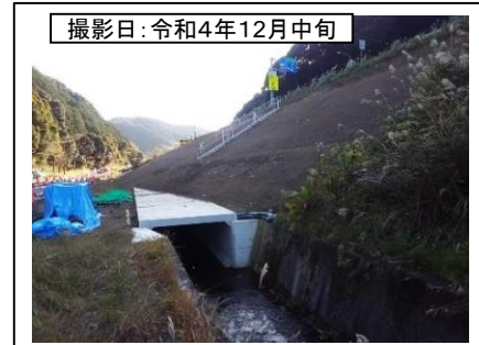
撮影日: 令和4年12月中旬