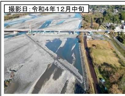
撮影日: 令和4年12月中旬