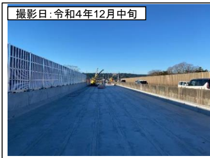
撮影日: 令和4年12月中旬