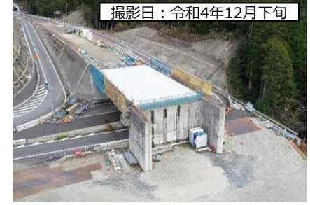
⑦東栄IC（浜松方面を望む）