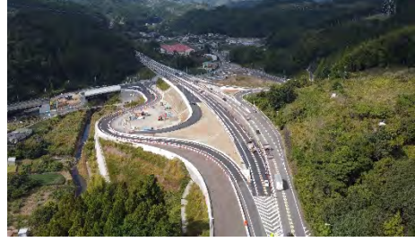
②菊川IC(名古屋方面を望む)