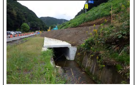
⑧野田IC(水路ボックス)