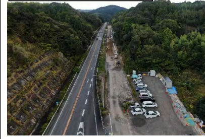
⑦旗指IC(東京方面を望む)