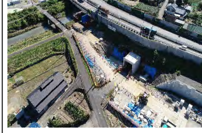
③大代IC(上り線オフランプ橋)