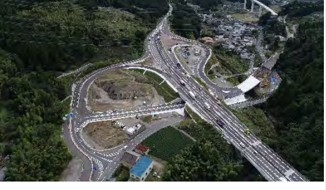
①菊川IC(東京方面を望む)