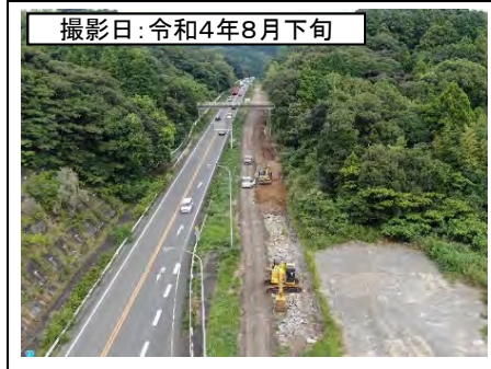
⑦旗指IC(東京方面を望む)