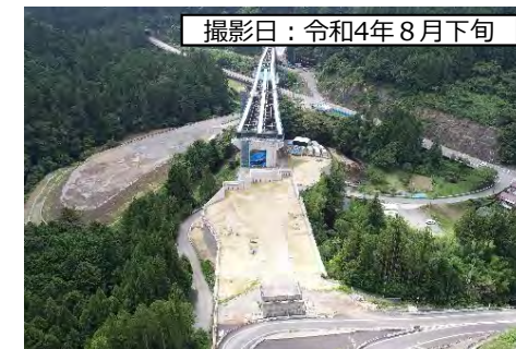
⑧東栄IC (浜松方面を望む)