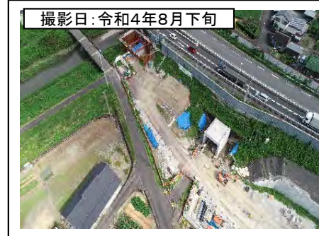
③大代IC付近(上り線オフランプ橋)