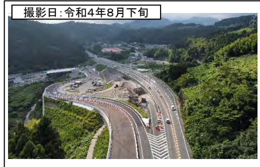
②菊川IC(名古屋方面を望む)