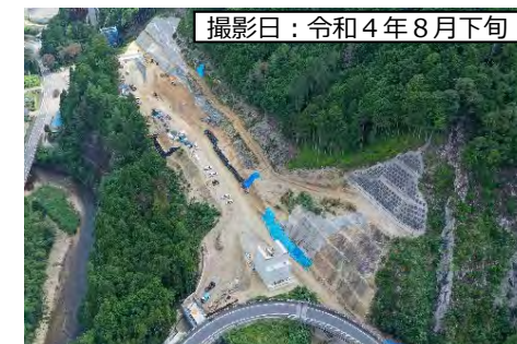
④鳳来峡IC (飯田方面を望む)