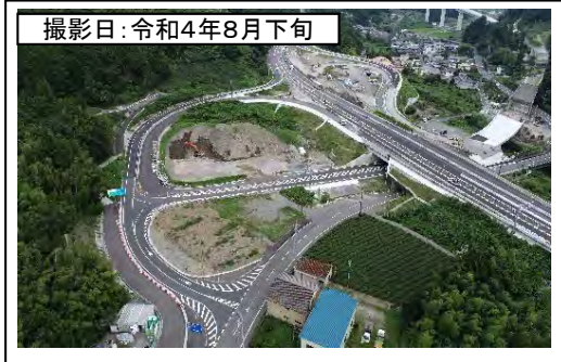
①菊川IC(東京方面を望む)