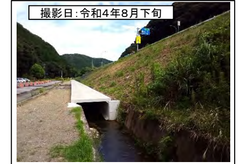
⑧野田IC(水路ボックス)