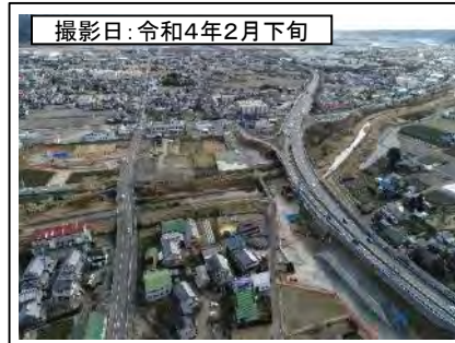
撮影日: 令和4年2月下旬