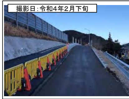
撮影日: 令和4年2月下旬