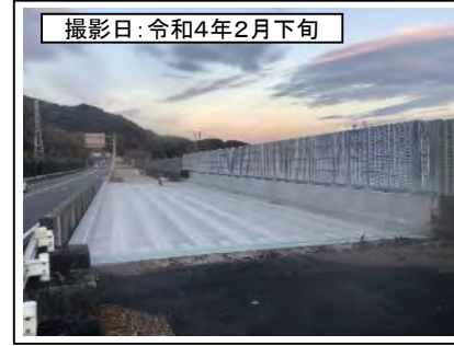
撮影日: 令和4年2月下旬