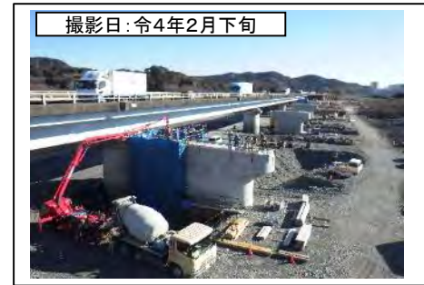
撮影日: 令和4年2月下旬