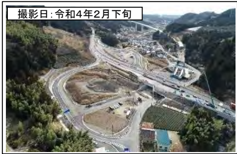
撮影日: 令和4年2月下旬