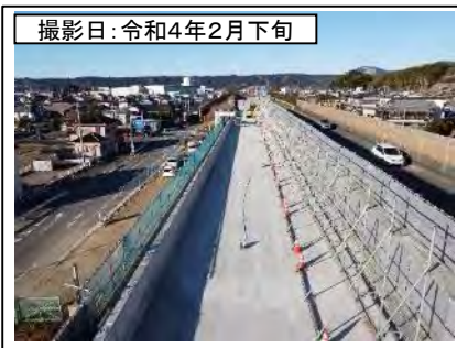
撮影日: 令和4年2月下旬