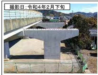
撮影日: 令和4年2月下旬