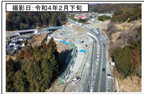
撮影日: 令和4年2月下旬