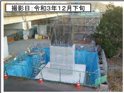
撮影日: 令和3年12月下旬