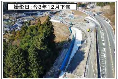
撮影日: 令和3年12月下旬