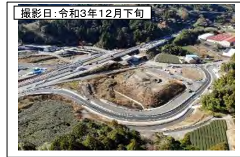
撮影日: 令和3年12月下旬