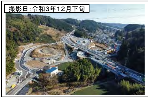
撮影日: 令和3年12月下旬