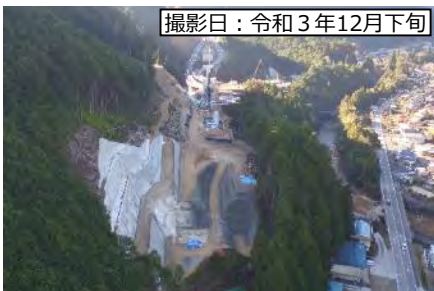
撮影日：令和3年12月下旬