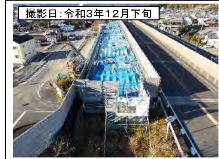
撮影日: 令和3年12月下旬