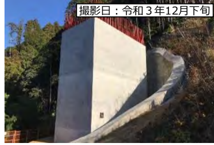
撮影日：令和3年12月下旬