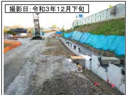
撮影日: 令和3年12月下旬