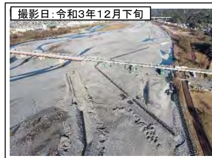
撮影日: 令和3年12月下旬