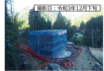
撮影日：令和3年12月下旬