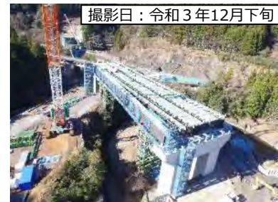
撮影日：令和3年12月下旬