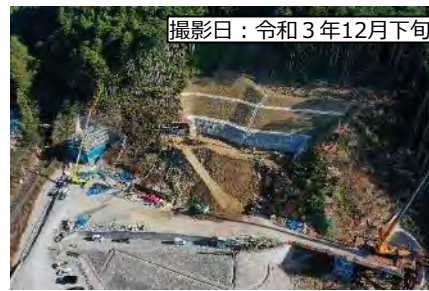
撮影日：令和3年12月下旬