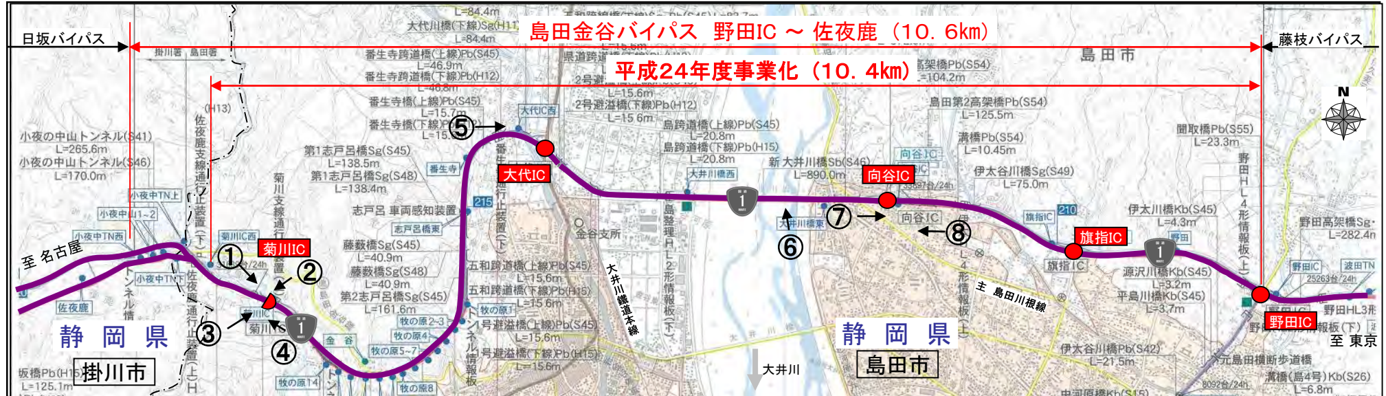
①上り菊川IC付近(東京方面を望む) ②上り菊川IC付近(牧ノ原方面を望む) ③下り菊川IC付近(東京方面を望む) ④下り菊川IC付近(名古屋方面を望む)