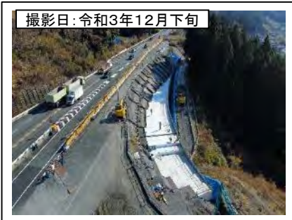
撮影日: 令和3年12月下旬