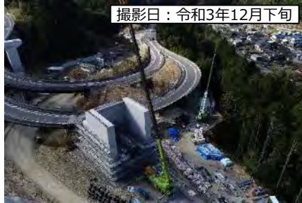
撮影日：令和3年12月下旬