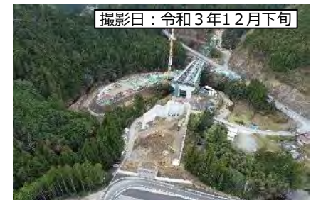
撮影日：令和3年12月下旬