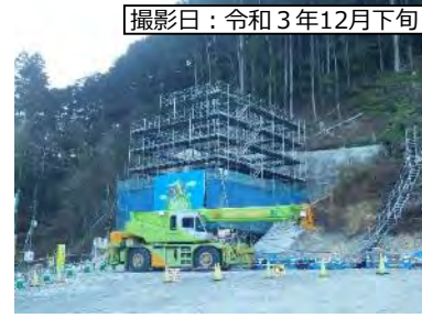
撮影日：令和3年12月下旬