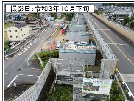
撮影日: 令和3年10月下旬