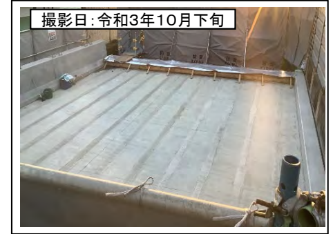
撮影日: 令和3年10月下旬