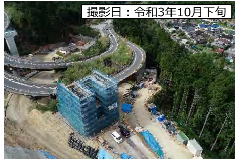
①9号橋 (仮称) A2橋台