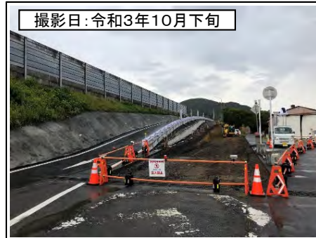
撮影日: 令和3年10月下旬