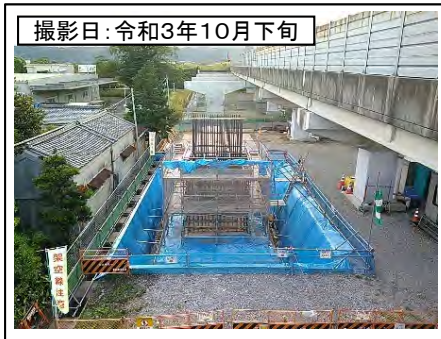
撮影日: 令和3年10月下旬