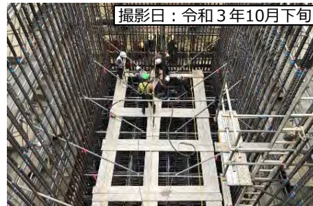
②8号橋 (仮称) P1橋脚