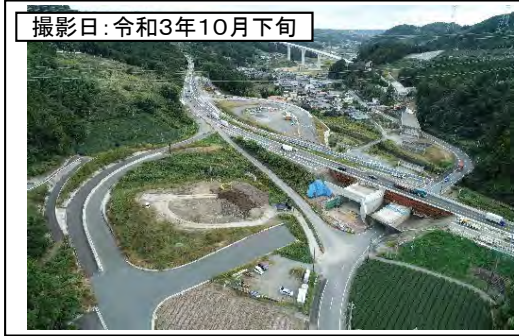
撮影日: 令和3年10月下旬