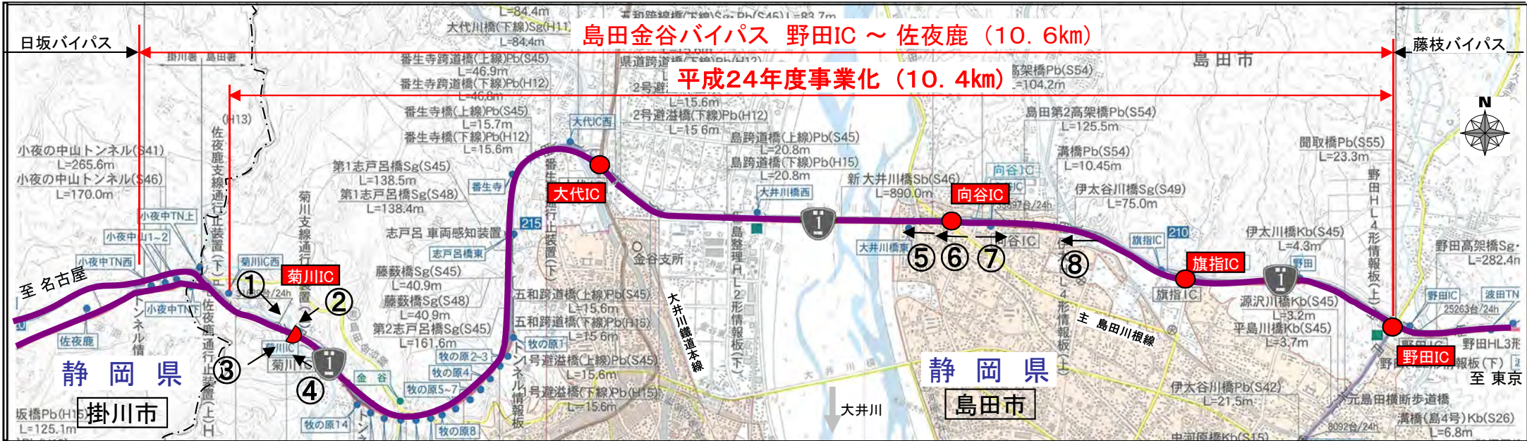
④下り菊川IC付近(名古屋方面を望む)