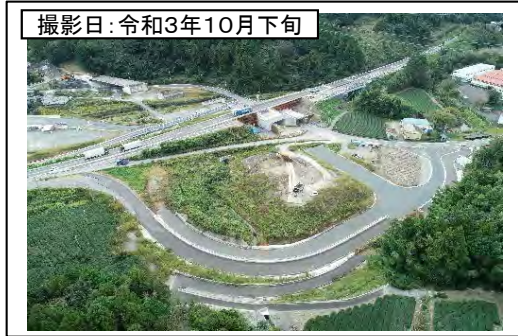
撮影日: 令和3年10月下旬