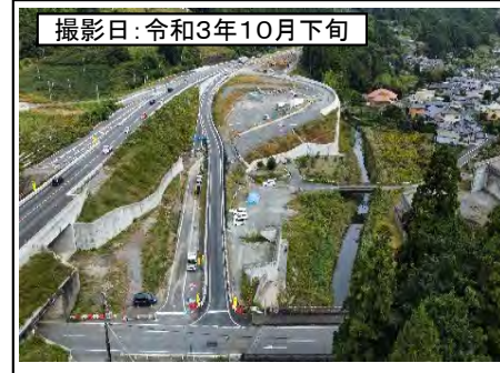
撮影日: 令和3年10月下旬