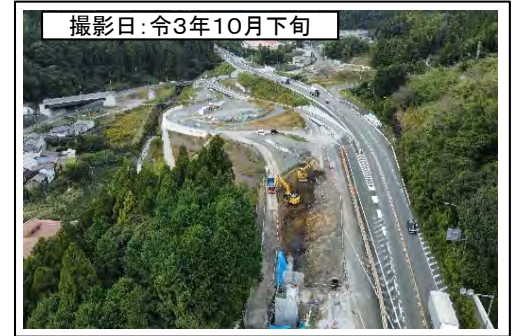
撮影日: 令和3年10月下旬